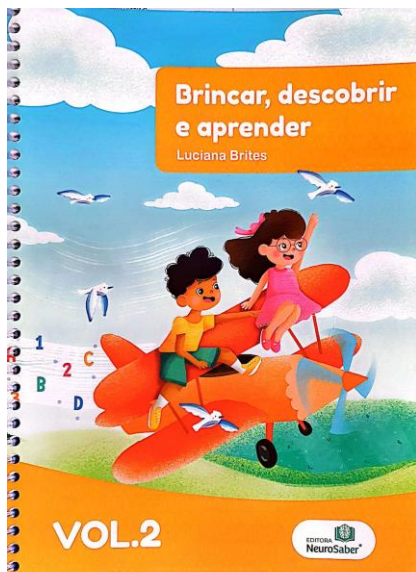
Livro integrado (adotado na escola no início do ano letivo)